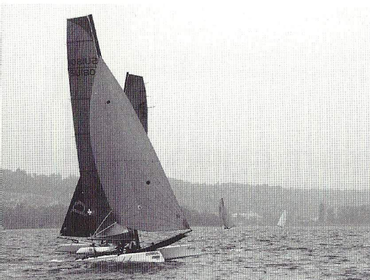
SUI801 vor SUI99 auf dem Weg in's Ziel

nale 18HT Vereinigung als Austragungsort nach 2007 zum zweiten Mal den Thunersee bestimmt hat. Nach dem letztjährigen Teilnahmerecord von 23 Booten in Porto Corsini, Italien, fanden sich dieses Jahr nach drei kurzfristigen Absagen 18 Boote am Thunersee ein.