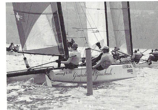
Grandhotel Giessbach (SUI801) am Start.

Neben der Schweiz verzeichnen vor allem Italien und Deutschland ein starkes Wachstum in der 18HT Familie. Sehr enge, grenzüberschreitende Bekanntschaften auf freundschaftlicher Ebene führten neben den erwähnten nationalen Cup-Regatten zur regelmässigen Organisation von internationalen Regatta-Anlässen in ganz Europa, woraus über die Zeit die 18HT Euro als fixer Punkt im Kalender der europäischen 18HT Szene hervorgegangen ist. In der Saison 2009 wurde die 18HT Euro zum sechsten Mal durchgeführt, wobei die Internatio-