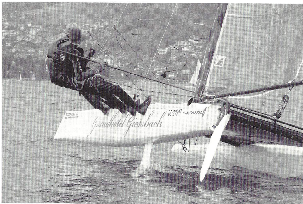
Catweekend in Spiez