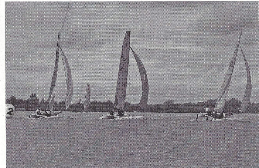
18HT German Open IDB 2006, Altmühlsee.